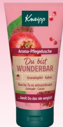
Granatapfel & Kakao