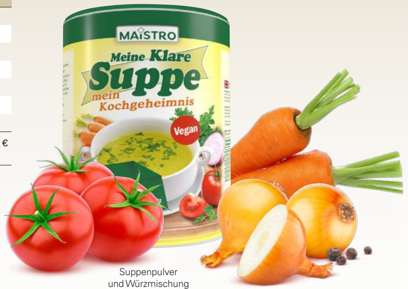
Suppenpulver und Würzmischung