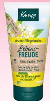
Litsea Cubeba & Zitrone