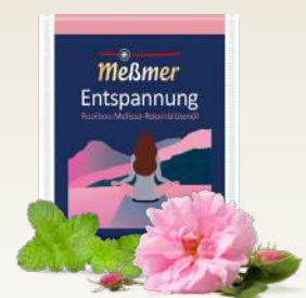
Entspannung Rooibos-Melisse- Rosenblütenöl