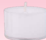
Teelicht (transparente Hülle)