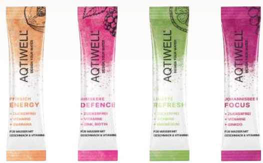
Pfirsich Himbeere Limette Johannisbeere