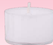
Teelicht (transparente Hülle)