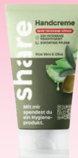
Aloe Vera & Olive

ZUSÄTZLICHE WERBEFLÄCHE AUF DER RÜCKSEITE