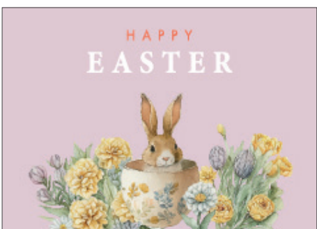
219168 Retro Easter Pink