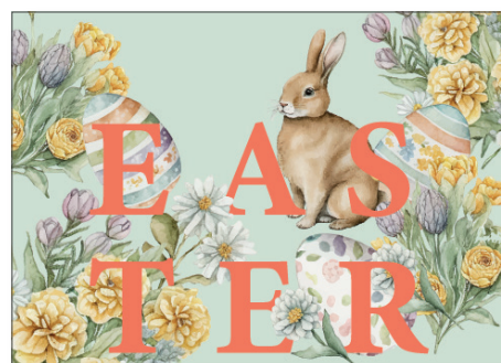
219169 Retro Easter Green