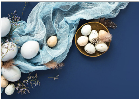
219165 Edle Ostereier