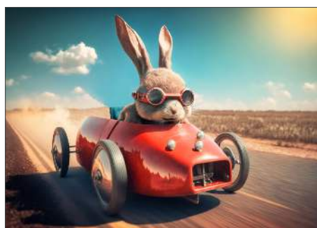
216603 Race Bunny