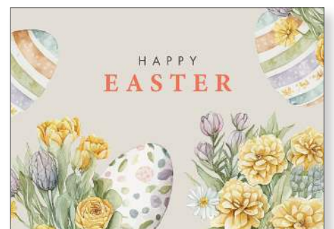
219170 Retro Easter Grey